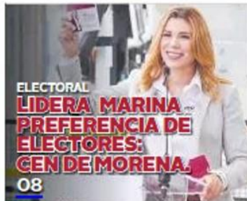
ELECTORAL LIDERA MARINA PREFERENCIA DE ELECTORES: GEN DE MORENA. 08

el debate organizado por el Instituto Estatal Electoral de Baja California (Ieebc) a partir de las 20:00 horas.