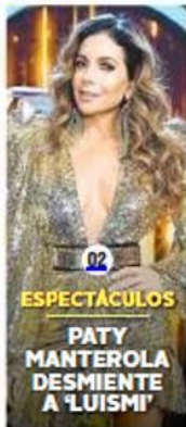
ESPECTÁCULOS PATY MANTEROLA DESMIENTE A 'LUISMI'

MEXICALI ANALIZAN CIERRE DE ANTRO 'EL RELAJO'. 04